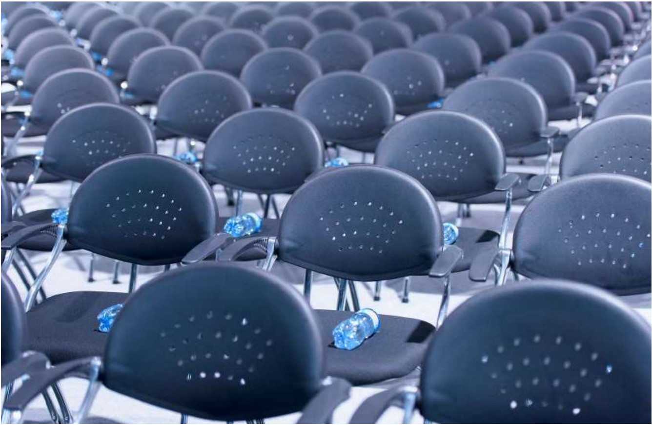
Leere Stühle an einer Generalversammlung: Nur noch wenige Aktionäre kommen, die meisten lassen sich vertreten.